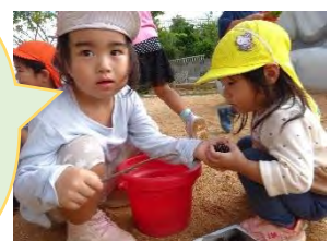
↑小さいお友だちも興味津々♪

想像力、発想力豊かな子どもたち。工夫したり試したり、観察したり・・・様々な遊び方を楽しんでいました。自然物を通して季節の移り変わりを感じながら、子どもたちの好奇心や五感を刺激する活動となりました！