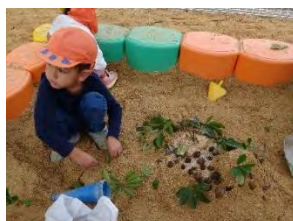
↑葉っぱの位置にこだわってデコレーション