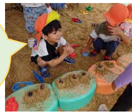
↑お好み焼き～ケーキ～パンと、作っていくうちに変化していました。