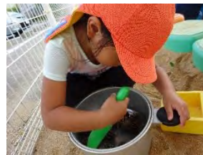
↑食材に見立て、お料理♪